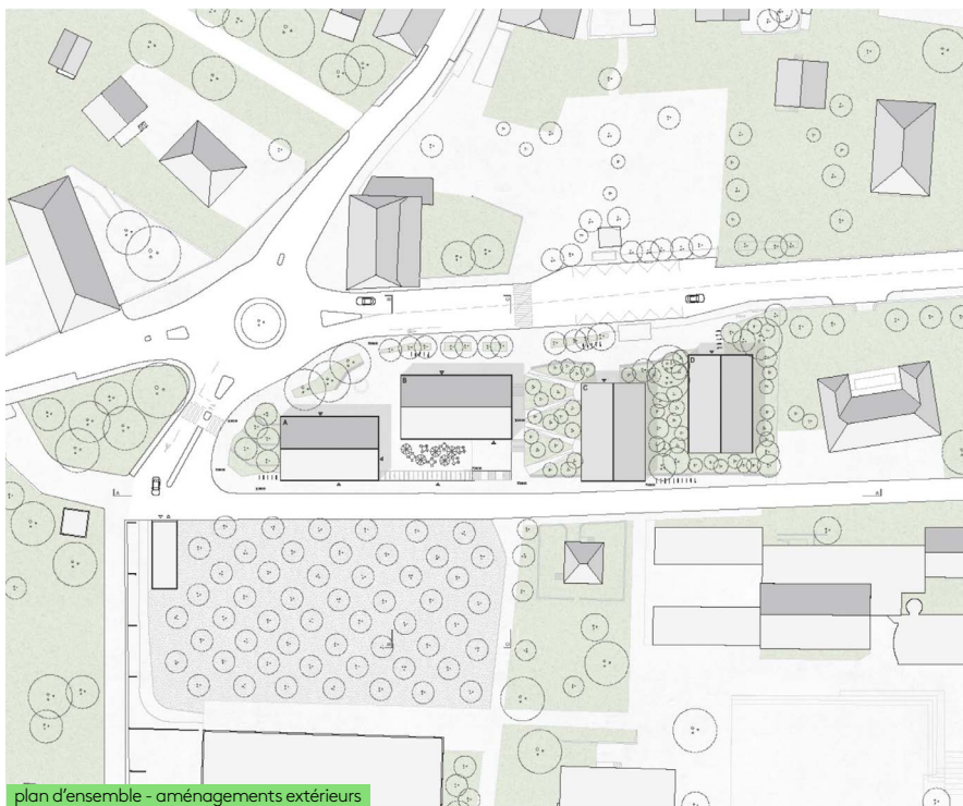
plan d'ensemble - aménagements extérieurs