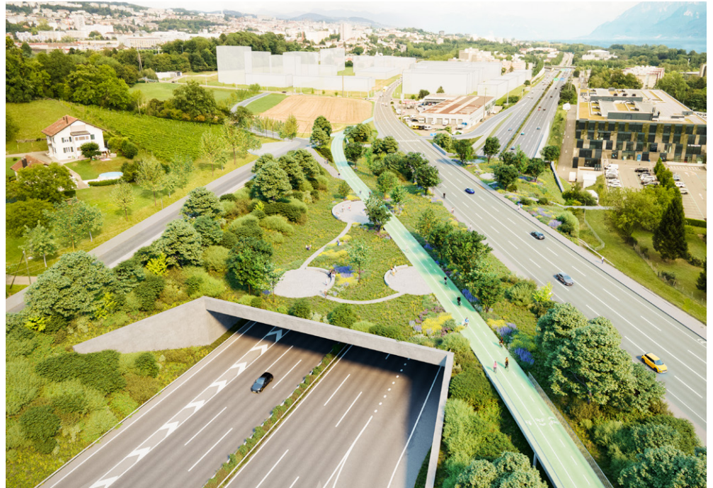
Modélisation de l'ouvrage projeté

Etude d'intégration paysagère de la nouvelle jonction en 3 variantes