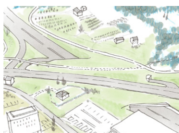
variante «couverture colline»