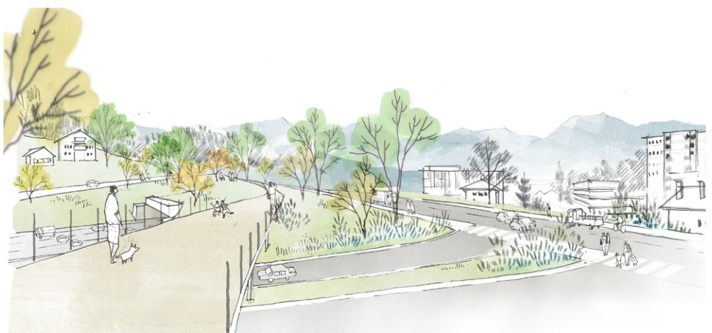
un nouvel espace riche en potentiel